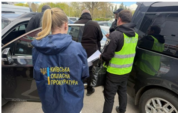
Фото: затримання співробітників ТЦК

У Білій Церкві викрили схему ухилення від мобілізації, де за гроші анулювали повістки та оформлювали фіктивне бронювання.