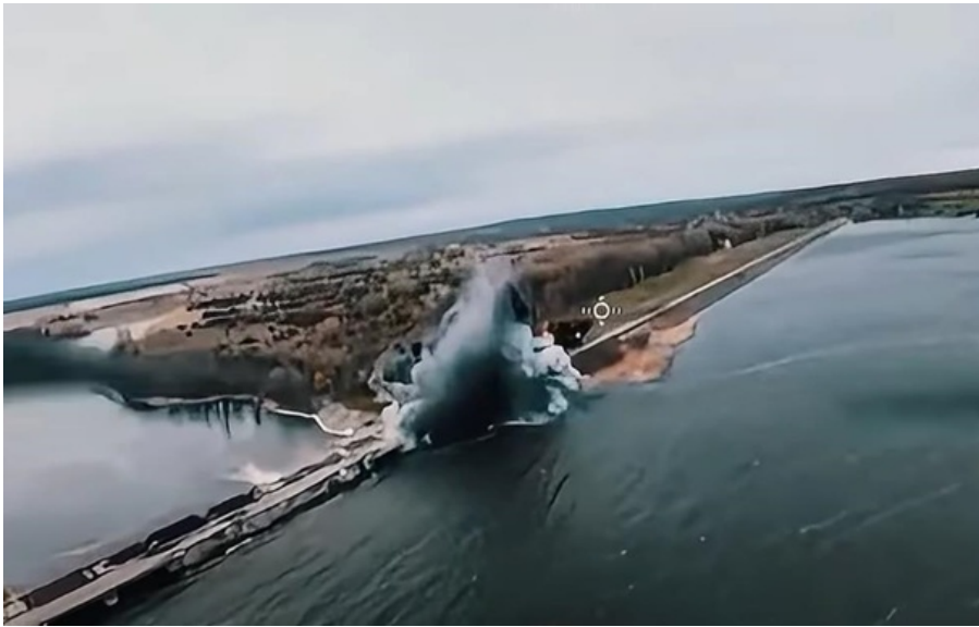
Ситуація повністю моніториться

Дамба не пошкоджена. Скид води відбувається у плановому контрольованому режимі.