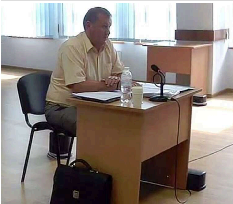
Справа про вбивство 13-річної давнини: в Одесі суддя з 2019 року не може винести вирок у справі з готовим обвинуваченням