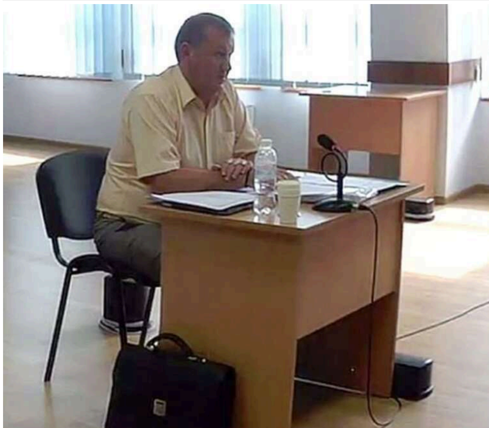
Справа про вбивство 13-річної давнини: в Одесі суддя з 2019 року не може винести вирок у справі з готовим обвинуваченням