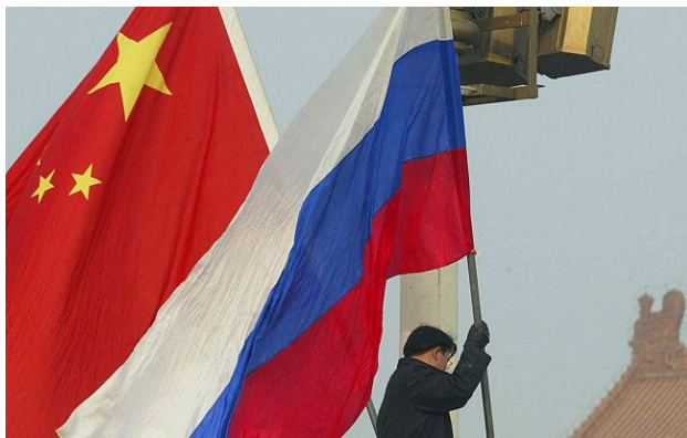
Фото: прапори Росії та Китаю

Попри санкції, Росія продовжує отримувати ключові технології через Китай, а ЄС зволікає з посиленням тиску, побоюючись наслідків.