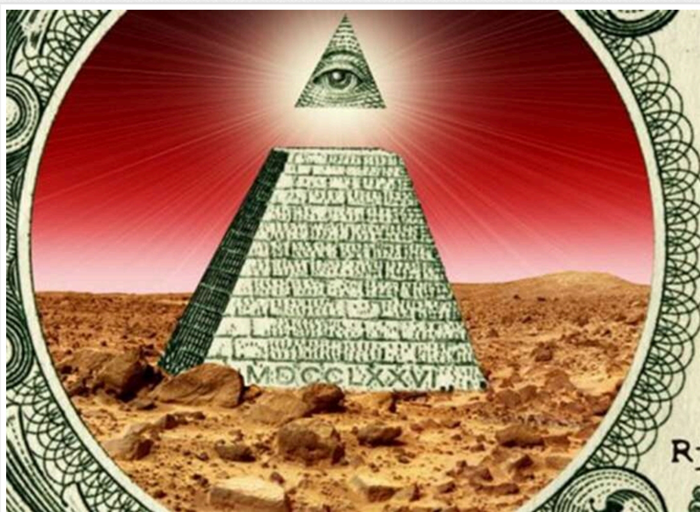
Чи буде австрієць Ашер Давідов (Asher Davidov) фінансову піраміду за прикладом Бернарда Мейдоффа?

Сполучені Штати Америки, 29 липня 2009 року Бернарда Мейдоффа (Bernard Lawrence Madoff) засуджено судом Нью-Йорка до 150 років ув'язнення за організацію найбільшої в історії фінансової піраміди на суму близько 64,8 мільярда доларів, повідомляє Lenta.UA.