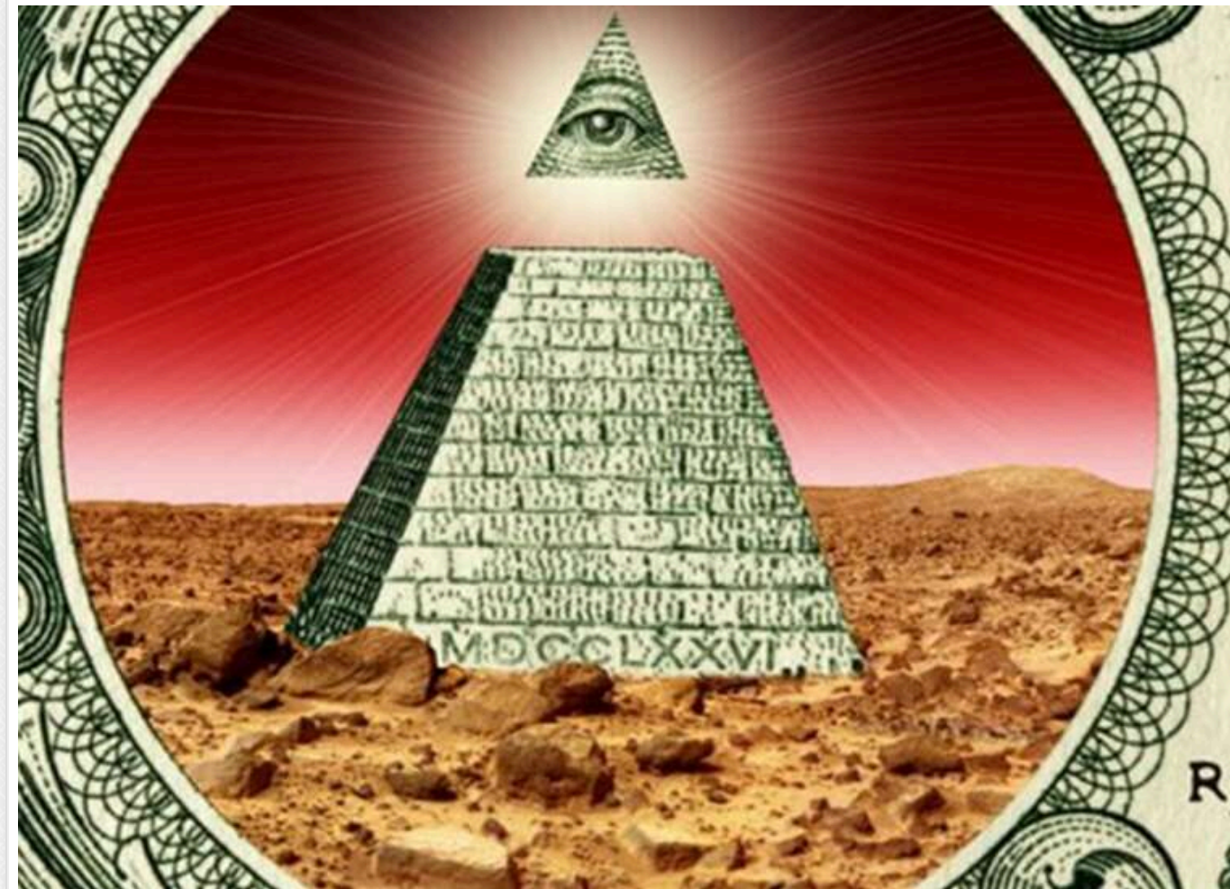
Чи буде австрієць Ашер Давідов (Asher Davidov) фінансову піраміду за прикладом Бернарда Мейдоффа?

Сполучені Штати Америки, 29 липня 2009 року Бернарда Мейдоффа (Bernard Lawrence Madoff) засуджено судом Нью-Йорка до 150 років ув'язнення за організацію найбільшої в історії фінансової піраміди на суму близько 64,8 мільярда доларів, повідомляє Lenta.UA.