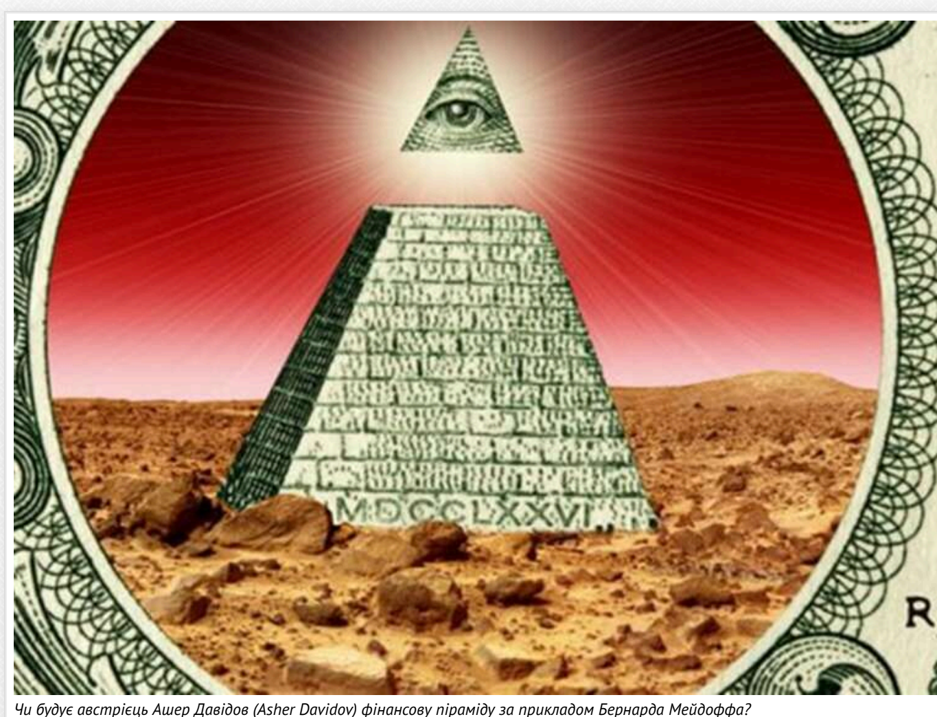
Чи буде австрієць Ашер Давідов (Asher Davidov) фінансову піраміду за прикладом Бернарда Мейдоффа?

Сполучені Штати Америки, 29 липня 2009 року Бернарда Мейдоффа (Bernard Lawrence Madoff) засуджено судом Нью-Йорка до 150 років ув'язнення за організацію найбільшої в історії фінансової піраміди на суму близько 64,8 мільярда доларів, повідомляє Lenta.UA.