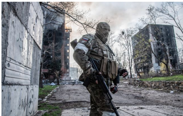
Фото: російські військові (Gettyimages)

У ГУР повідомили, що військові РФ із 7-ї десантно-штурмової дивізії використовують цивільний одяг для маскування на Орхівському напрямку в Запорізькій області.