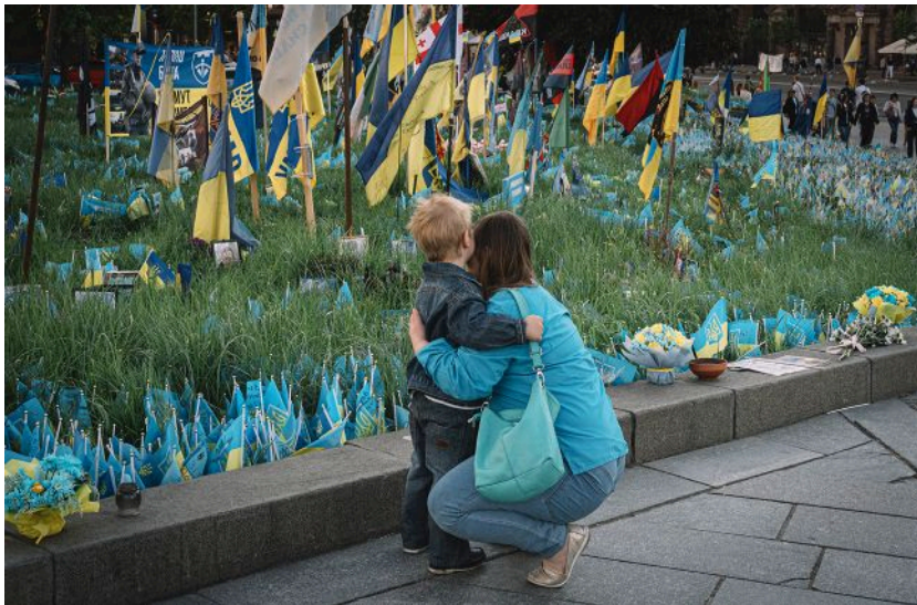
Перелік документів, необхідних для видачі посвідчень, оновили