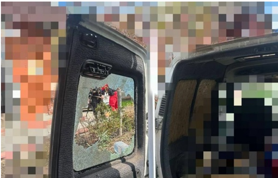
Росіяни скинули вибухівку з дрона на одну з вулиць Херсона

Війська РФ за допомогою дрона вбили 89-річну жінку та травмували 52-річного чоловіка в Херсоні.