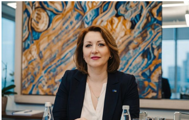
Криміналізація закупівель електроенергії посилюється

Практика застосування судових рішень у сфері публічних закупівель електроенергії призводить до криміналізації дій, які раніше вважалися стандартною ринковою поведінкою.