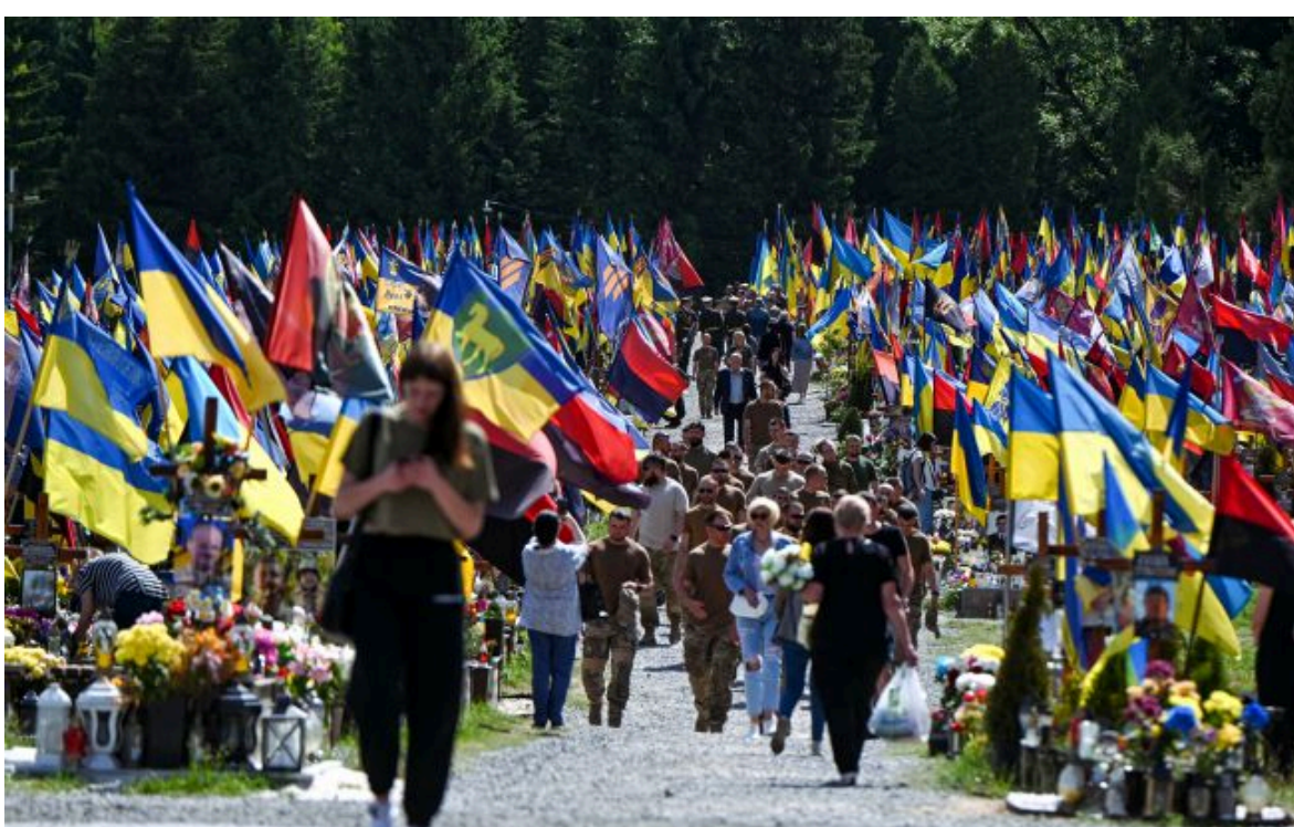
Фото: Личаківське військове кладовище у Львові Getty Images)