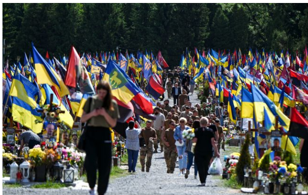
Фото: Личаківське військове кладовище у Львові Getty Images)

Верховна Рада дозволила поховання загиблих військовослужбовців із непогашеною або незнятою судимістю на Національному військовому меморіальному кладовищі. Відповідний закон ухвалили 30 квітня.