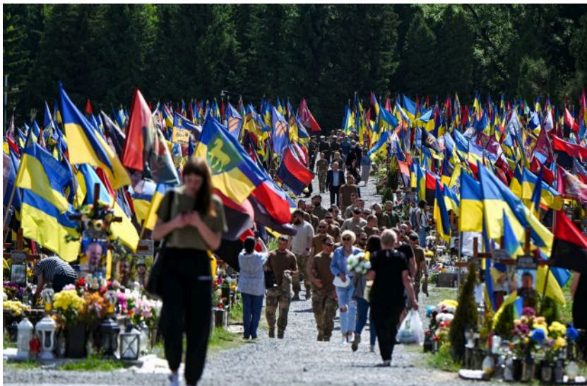
Фото: Личаківське військове кладовище у Львові

Обирайте перевірене - додайте РБК-Україна до улюблених джерел у Google