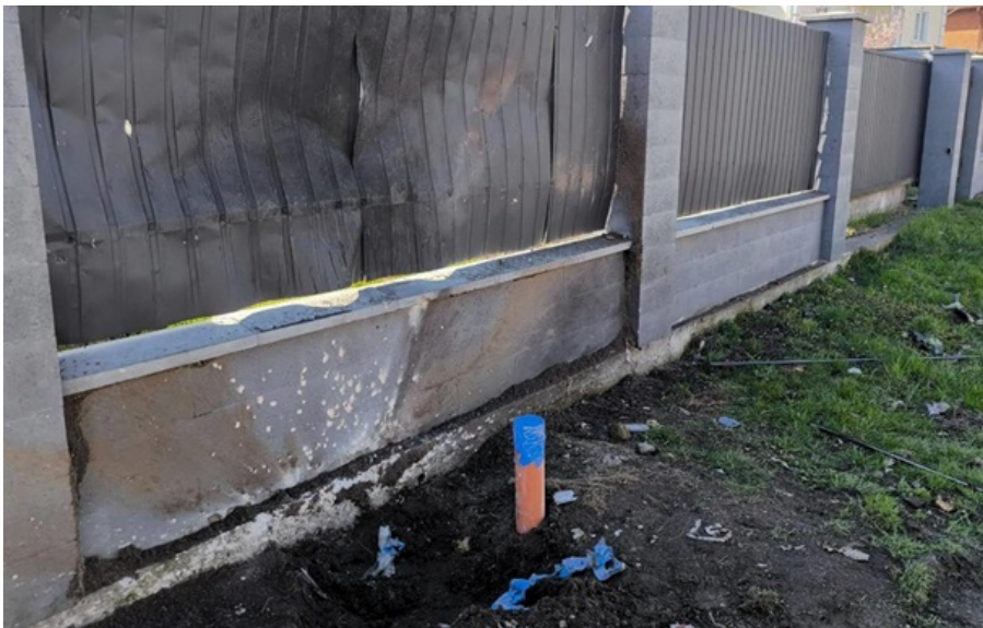
Місце вибуху в Броварах

Одного з фігурантів затримали на вокзалі у місті Могилів-Подільський Вінницької області, звідки він намагався виїхати за межі України.