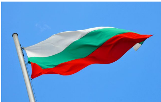
Фото: прапор Болгарії (flickr.com)

У Болгарії проросійська партія "Відродження" внесла до парламенту проєкт резолюції про розірвання 10-річної безпекової угоди з Україною.