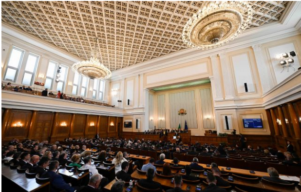
Фото: парламент Болгарії

У Болгарії проросійська партія "Відродження" внесла до парламенту проєкт резолюції про розірвання 10-річної безпекової угоди з Україною.