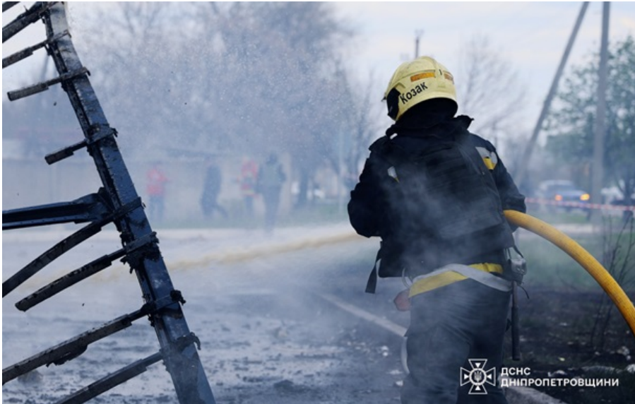
Рятувальники лікують наслідки ворожого удару

Загиблі та поранені – цивільні, котрі рухалися автодорогою на власних автомобілях.