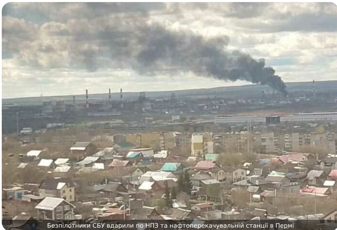
Безпілотники СБУ вдарили по НПЗ та нафтоперекачувальній станції в Пермі

Безпілотники Центру спецоперацій "Альфа" СБУ вдруге за дві ночі успішно відпрацювали по російській нафтовій інфраструктурі поблизу міста Перм, що за понад 1500 км від України.