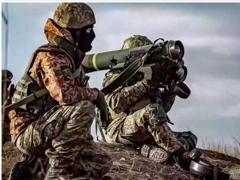
Ситуація на фронті: зафіксовано 41 боєзіткнення, з них 24 на Костянтинівському і Покровському напрямках

Від початку доби агресор 41 раз атакував позиції Сил оборони.