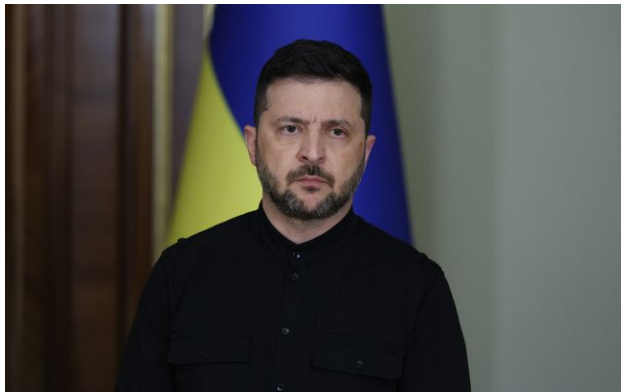
Фото: Володимир Зеленський (Getty Images)

Російський диктатор Володимир Путін може використати тему припинення вогню для скасування деяких санкцій. Водночас жодних сигналів від РФ або США щодо переговорів Київ не отримував.