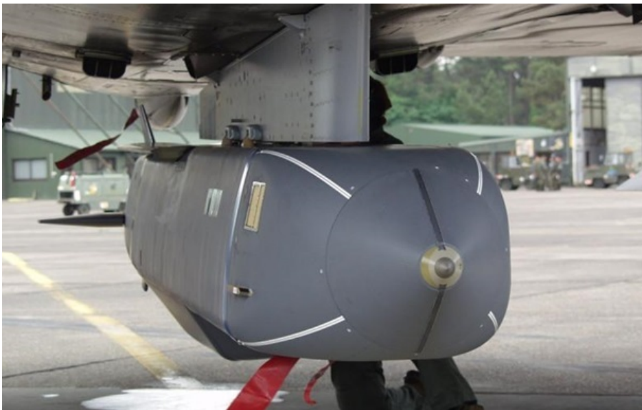
Ракети SCALP уразили важливі цілі окупантів

Також ударні українські безпілотники уразили склади боєприпасів противника в районах трьох населених пунктів на ТОТ.