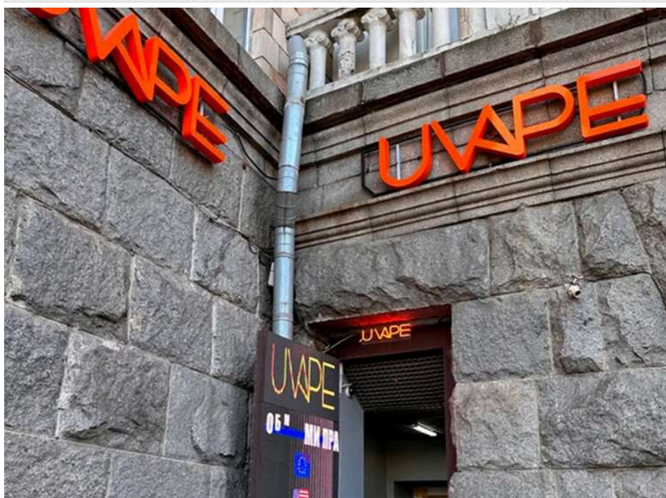
Схема з продажу вейпів, про ліквідацію якої звітував Олександр Цивінський, продовжую працювати прямо в центрі столиці

Відома мережа з продажу вейпів, про ліквідацію якої нещодавно звітувало БЕБ на чолі з директором Олександром Цивінським, продовжує працювати, ухиляючись від сплати податків.