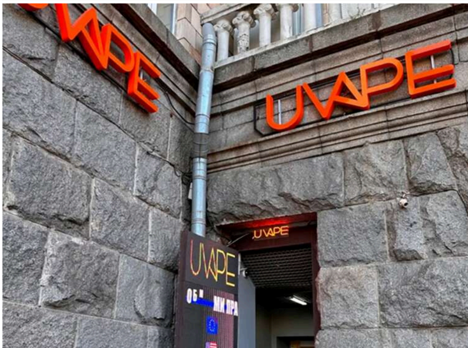
Схема з продажу вейпів, про ліквідацію якої повідомляв Олександр Цивінський, продовжує діяти прямо в центрі столиці

Відома мережа з продажу вейпів, про ліквідацію якої нещодавно звітувало БЕБ на чолі з директором Олександром Цивінським, продовжує працювати, ухиляючись від сплати податків.