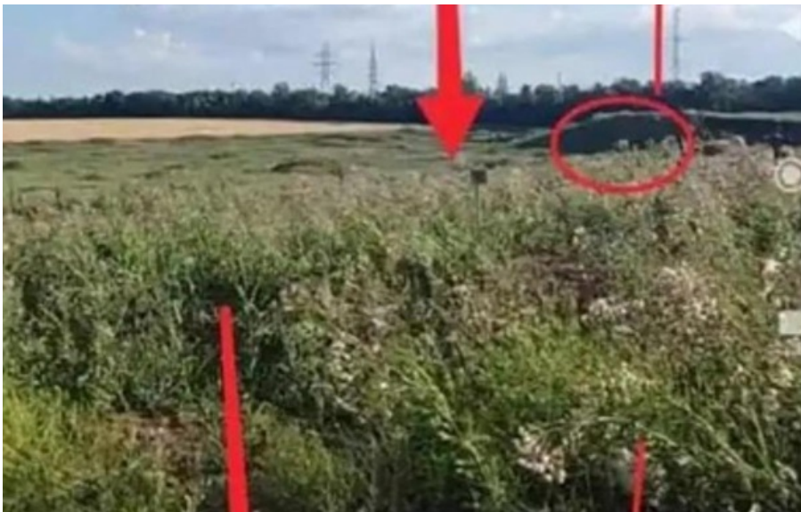
Дослідники фонду Mariupol Destruction and Victims виявили приховане масове поховання завдовжки понад 50 метрів

Автори проекту помітили цю ділянку на супутникових знімках у 2023 році; сама ж вона з'явилася 2022 році.