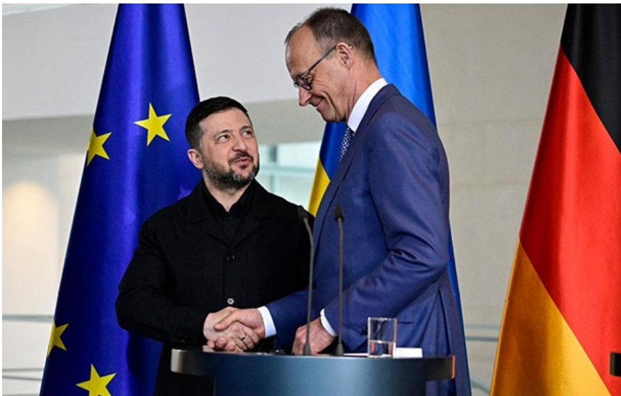
Зеленський і Мерц на пресконференції в Берліні 14 квітня

Мова йде про домовленості щодо ППО, а саме – про ракети PAC-2 для систем Patriot, нові пускові установки та інші речі.