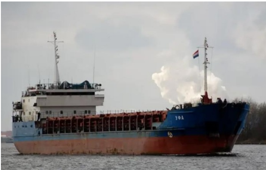
Судно було задіяне у викраденні зерна з ТОТ України

Арешт суховантажу здійснили для подальшого розгляду судом питання про можливу передачу іншій державі.