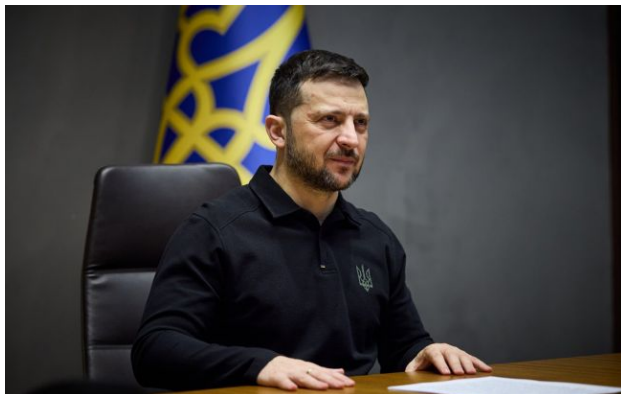
Фото: президент України Володимир Зеленський

Кремль прагне короткочасного перемир'я головним чином для того, щоб убезпечити військовий парад у Москві від потенційних українських ударів.