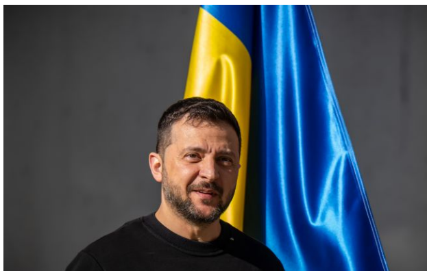
Фото: президент України Володимир Зеленський

Кремль прагне короткочасного перемир'я головним чином для того, щоб забезпечити військовий парад у Москві від потенційних українських ударів.