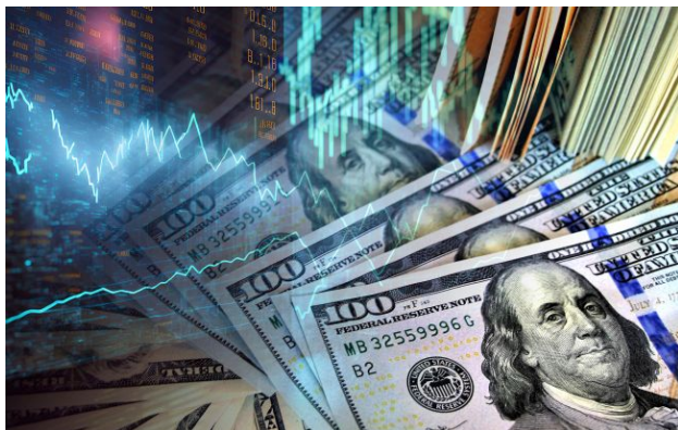
Фото: НБУ оновив офіційний курс валют на 1 травня (Getty Images)

Національний банк України встановив офіційний курс валют на п'ятницю, 1 травня. Після попередніх коливань долар і євро перейшли до зниження.