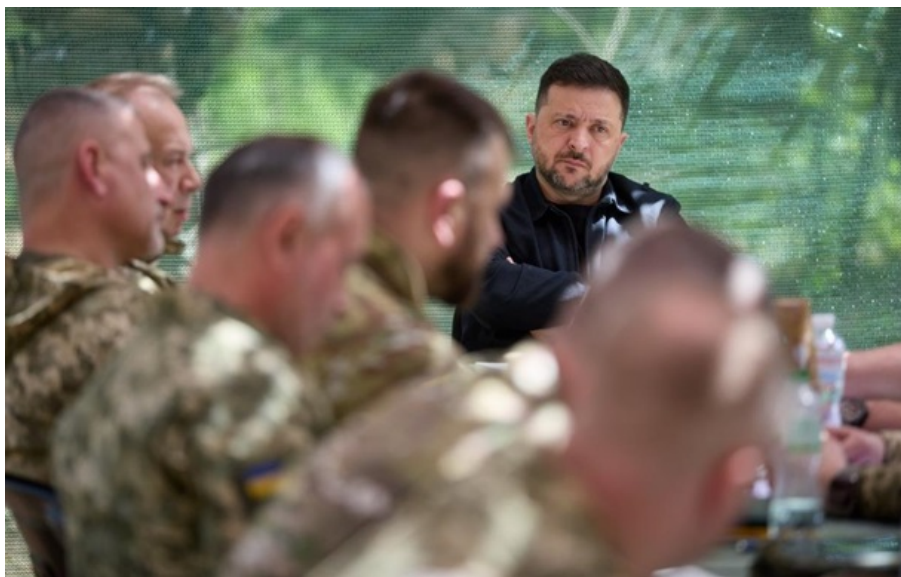
Володимир Зеленський під час поїздки на південний фронт 8 травня

Дніпропетровській області необхідно попрацювати над якістю доріг, оскільки, це – швидкість порятунку поранених воїнів, зазначив глава держави.