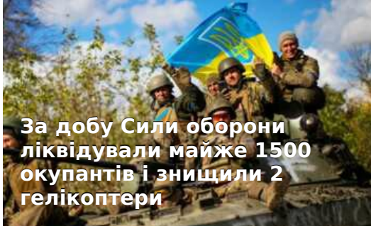
За добу Сили оборони ліквідували майже 1500 окупантів і знищили 2 гелікоптери