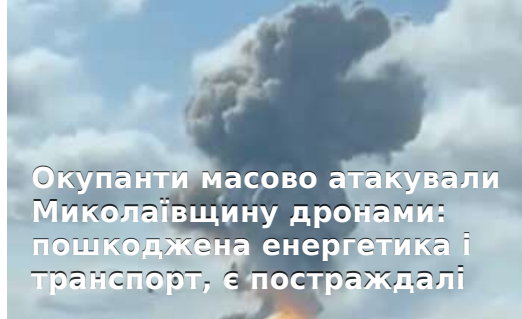
Окупанти масово атакували Миколаївщину дронами: пошкоджена енергетика і транспорт, є постраждалі