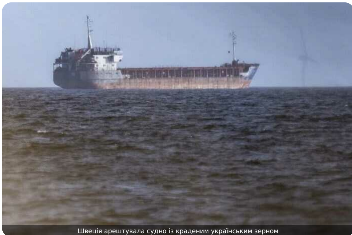
Швеція арештувала судно із краденим українським зерном

У Швеції арештували балкер Saffa, який на початку березня затримали біля узбережжя міста Треллеборг.