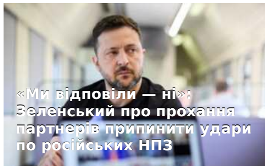
«Ми відповіли — ні»: Зеленський про прохання партнерів припинити удари по російських НПЗ