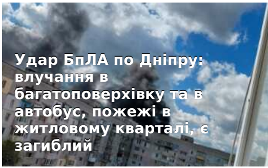
Удар БпЛА по Дніпру: влучання в багатоповерхівку та в автобус, пожежі в житловому кварталі, є загиблій