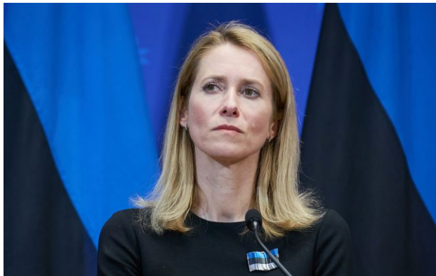
Фото: високий представник ЄС Кая Каллас (Getty Images)

Після розмов президента США Дональда Трампа та російського диктатора Володимира Путіна завжди залишається багато питань без відповідей.