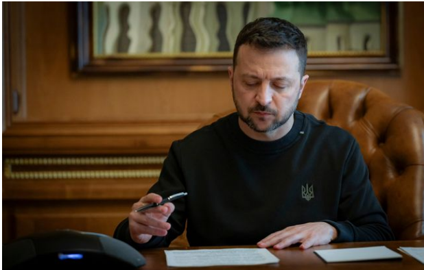
Фото: Володимир Зеленський, президент України (facebook.com_zelenskyy.official)

Президент України Володимир Зеленський у четвер, 30 квітня, підписав закони, які продовжують воєнний стан і мобілізацію ще на 90 днів.