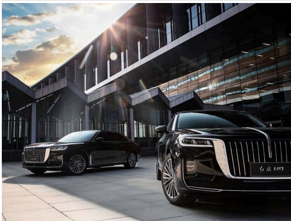
Оренда у самого себе та автівки на дружин: як 15 нардепів оновили свої автопарки на 76 мільйонів гривень під час війни

Одразу 15 народних депутатів стали власниками елітних автомобілів у 2025 році. За деклараціями, кожне таке авто коштує понад 3 млн грн, а сумарна вартість цих машин перевищила 76 млн грн.