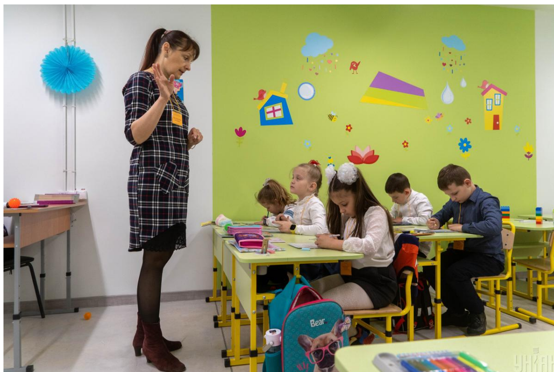
Школярі у підземній школі

Найважливіший – фізична безпека. Отже, наявність у школи якісного, гарно обладнаного, доступного бомбосховища/укриття, в яке малюки можуть швидко дістатись навіть не виходячи з приміщення школи; безпечного периметра навчального закладу, де діти не зустрінуть незнайомих, не вибігатимуть на дорогу тощо, наявність охорони у школі - це в сучасних умовах must have.