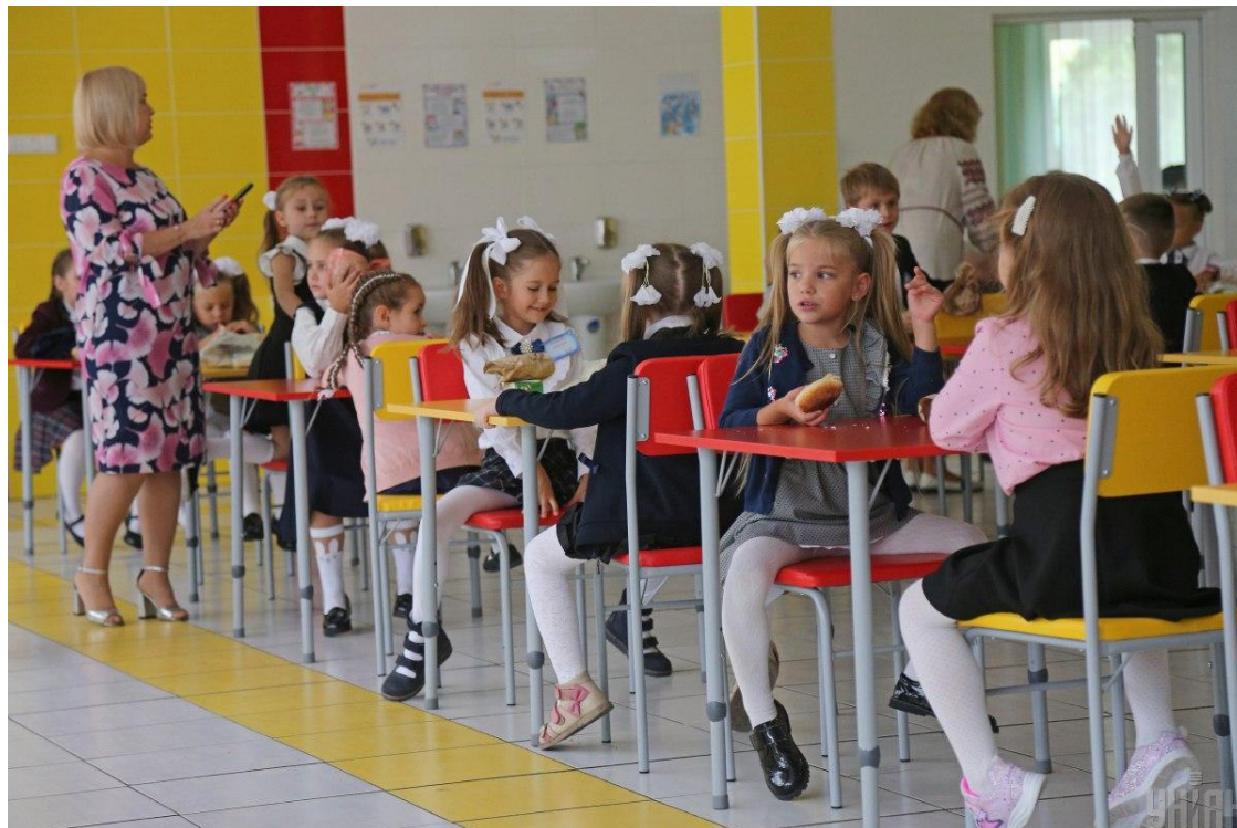
Обираючи школу, не варто забувати про підготовку самої дитини до неї

Середньостатистична родина, під час вибору навчального закладу, зараз найперше звертає увагу на його розташування: "Бувають випадки, що родина приймає рішення заради дитини переїхати з якогось гучного міста в інше, тихіше".