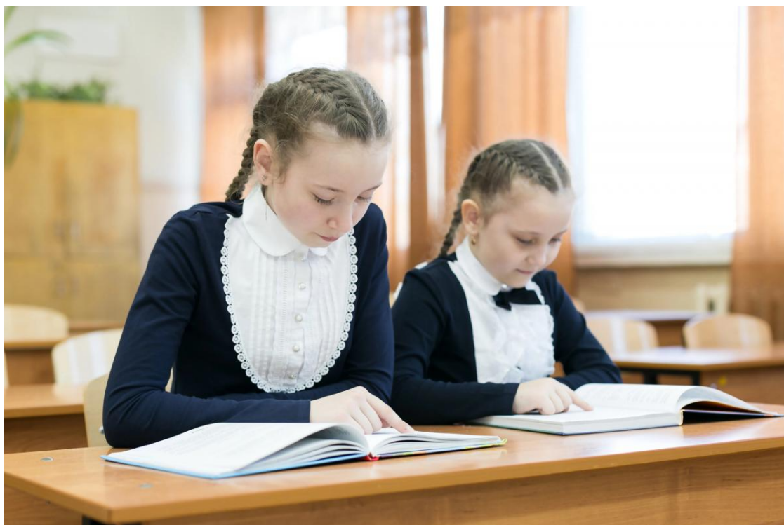
Сучасна школа істотно відрізняється від того, що було ще 20 років тому / фото

Також "старша школа", фактично, розділиться на два напрямки: академічні ліцеї для 10-12 класів будуть зосереджені на підготовці до університету та дослідницькій діяльності, а професійні коледжі/професійно-технічні училища - на подвійній освіті та можливості одразу працювати.