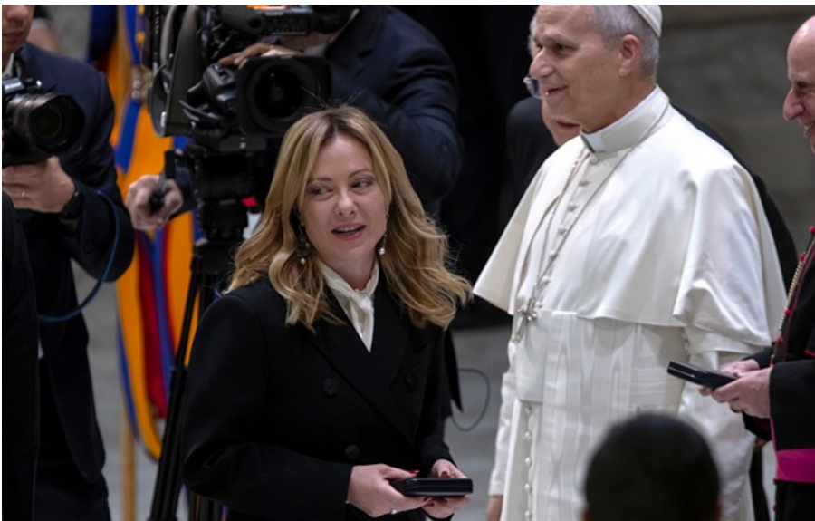
Джорджія Мелоні зреагувала на критику Трампа щодо Папи