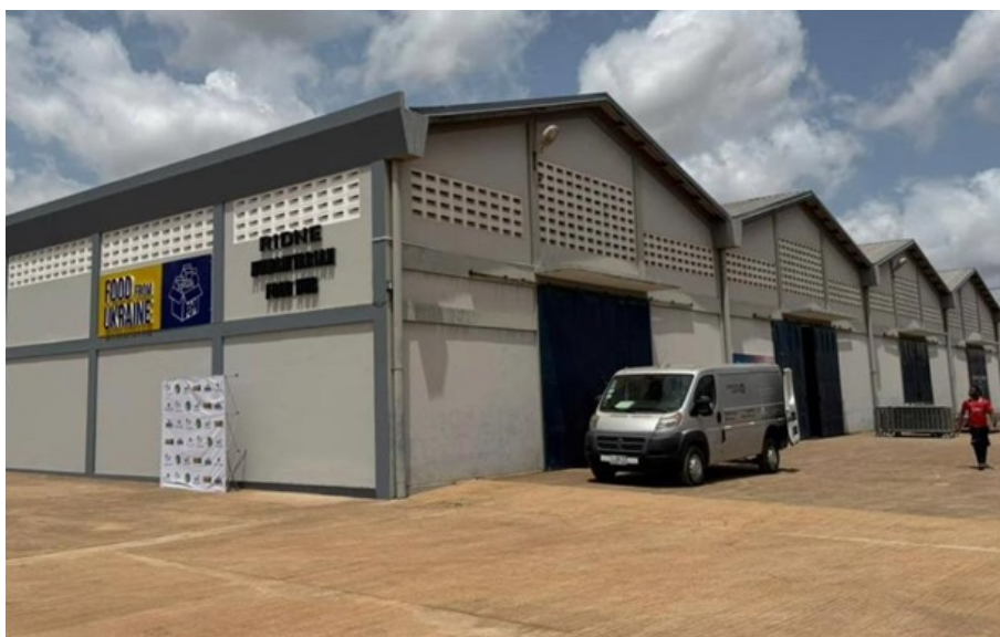
У Гані запрацював Центр переробки та розподілу продовольства

Україна розглядає Гану як важливого партнера для гуманітарної підтримки та розвитку торгівлі на західному узбережжі Африки.