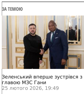
ЗА ТЕМОЮ Зеленський вперше зустрівся з главою МЗС Гани 25 лютого 2026, 19:49

"Це новий формат нашої присутності у світі, коли гуманітарна підтримка поєднується з розвитком партнерства і місцевої економіки. Українську продукцію поєднуюватимуть із місцевою, формуватимуть продовольчі набори та забезпечуватимуть їх розподіл. Наступний етап – розвиток переробки, пакування та порціонування безпосередньо в Гані", – розповіла прем'єр.