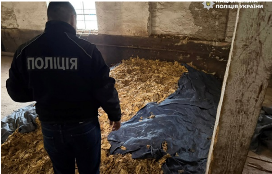
Фото: Нацполіція ДСР Нацполіції ліквідував незаконний канал постачання тютюну до підпільних цехів

Фактично фігуранти створили підпільне виробництво - від вирощування до збуту, обходячи податкові та ліцензійні вимоги. Правоохоронці вилучили понад 8 тонн тютюну