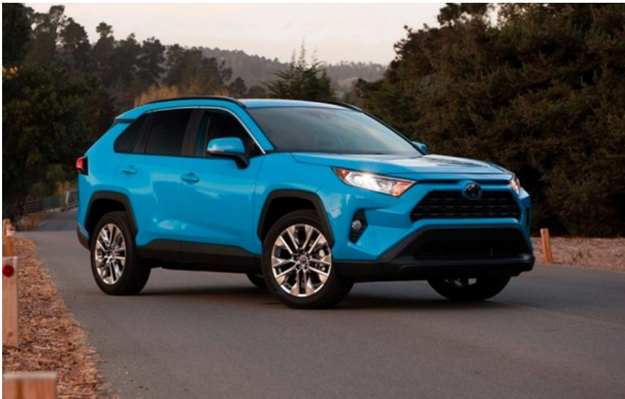
Автомобіль Toyota RAV-4

В сегменті нових легкових автомобілів лідером ринку гібридів залишається Toyota RAV-4 (442 од.)