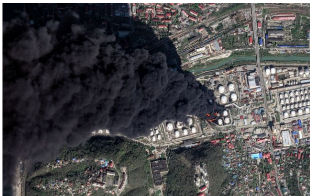
Фото: СБУ знову атакувала нафтову станцію та НПЗ у Пермі

На одному з найбільших НПЗ Росії у Пермі вже другу добу поспіль горить і вибухає. На відео видно, що лопнув четвертий резервуар, небо затягнуло густим димом, а з прилеглих районів евакуюють людей.