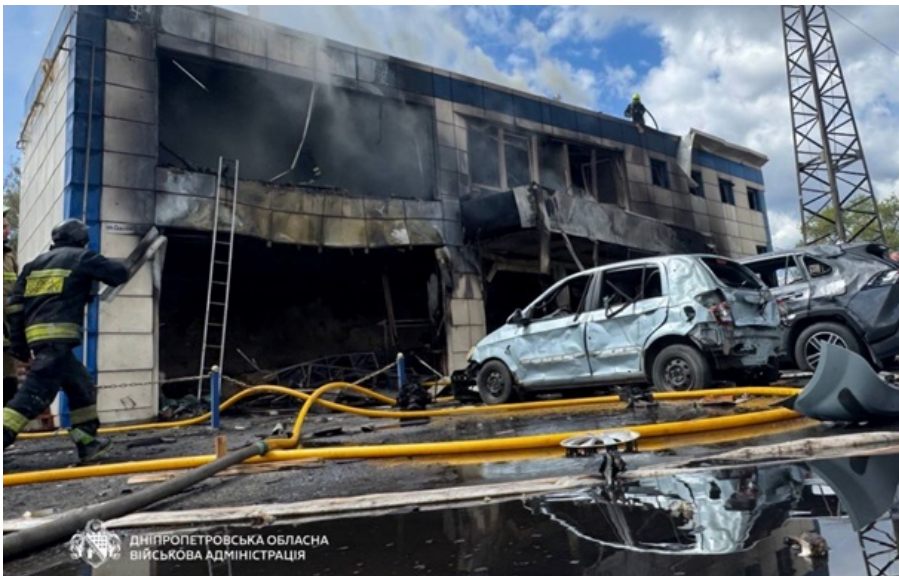
Наслідки удару по Дніпровському району

П'ятеро з них госпіталізовані. Один чоловік у важкому стані. Решта поранених - у стані середньої тяжкості.