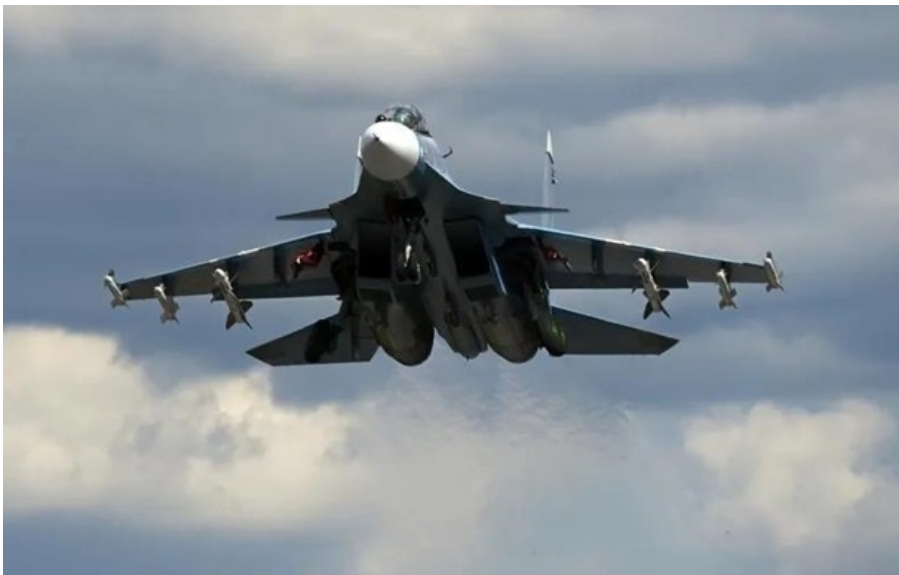
Російський Су-30 долітався над Кримом

Зеленський заявив про покращення справ на фронті; В Криму розбився черговий літак окупантів, а США в Ірані втратили відразу два літаки і вертоліт. Кореспондент.net виділяє головні події вчорашнього дня.