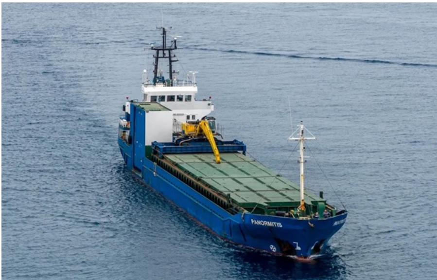
Судно Panormitis перевозить близько 26 тис. тонн ячменю і пшениці з України

Зірвано чергову спробу росіян легалізувати зерно, незаконно вивезене з тимчасово окупованих територій України.