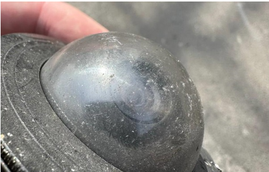
Дрони РФ стали маневренішими

Це може свідчити про використання нових технологій наведення, зокрема візуального контролю.