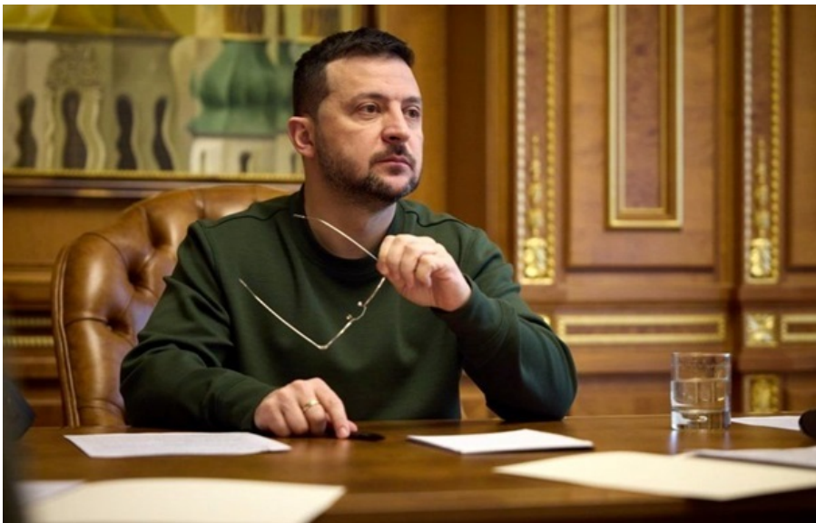
Володимир Зеленський підписав новий закон

Зеленський підписав закон, який вносить зміни до статті 161 Кримінального кодексу України.