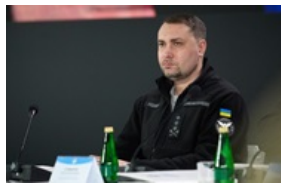
Буданов оцінив шанси на мирну угоду України з РФ 10 квітня 2026, 14:54

Зі статті Вікіпедії про Партію регіонів прибрали прізвище Порошенко 5