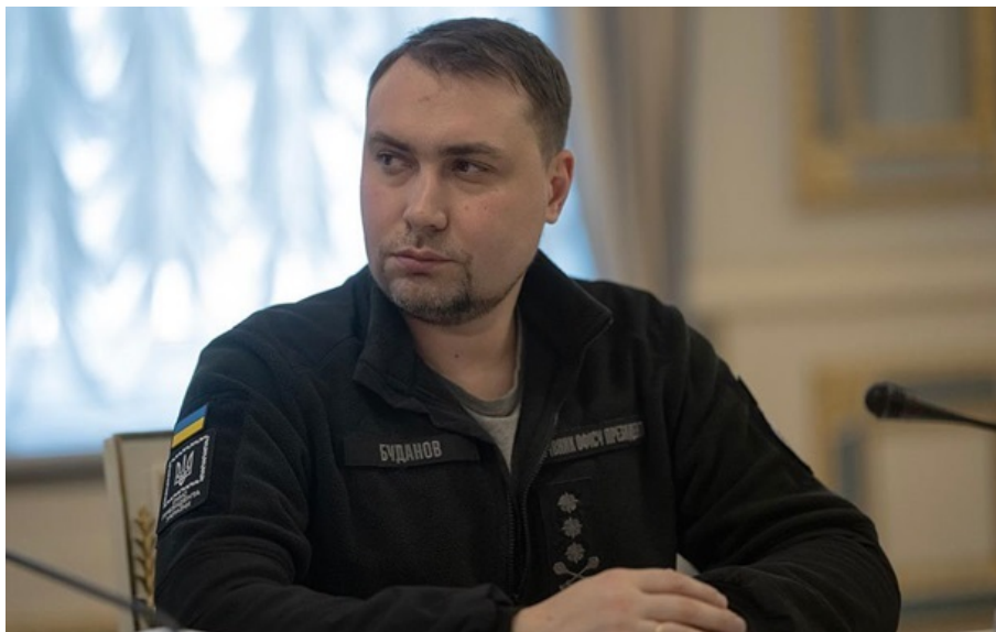
ЗМІ оцінили рішення Буданова за перші 100 днів на посаді голови Офісу президента

Основні зміни з приходом нового голови Офісу президента зводяться до трьох речей: швидкість ухвалення рішень, чітка вертикаль відповідальності та опора на глибоку аналітику, стверджує ТСН.