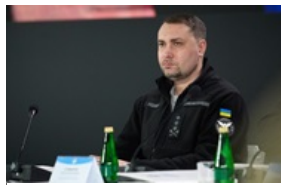
Буданов оцінив шанси на мирну угоду України з РФ 10 квітня 2026, 14:54

Активіст Ігор Луценко у лікарні - його побили 6